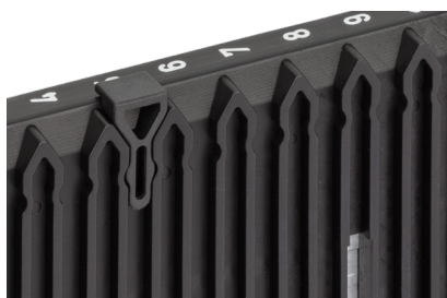
Bild mit Nutensperre

Die mit einem Rhombus gekennzeichnete Einstellnut liegt an jedem Ende der Nutenwand und ist um 0,25 mm weniger tief als alle anderen Nuten. Einfach die Printplatte in die Nutenwand klemmen, Nutenwand und Aluprofil verschrauben und schon haben Sie das Einschubmaß perfekt eingestellt.